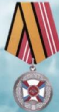
МЕДАЛЬ "ЗА УКРЕПЛЕНИЕ БОЕВОГО СОДРУЖЕСТВА"