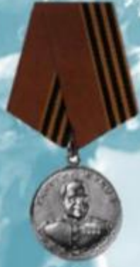
МЕДАЛЬ ОРДЕНА "ЗА ЗАСЛУГИ ПЕРЕД ОТЕЧЕСТВОМ" 1 И 2 СТЕПЕНИ