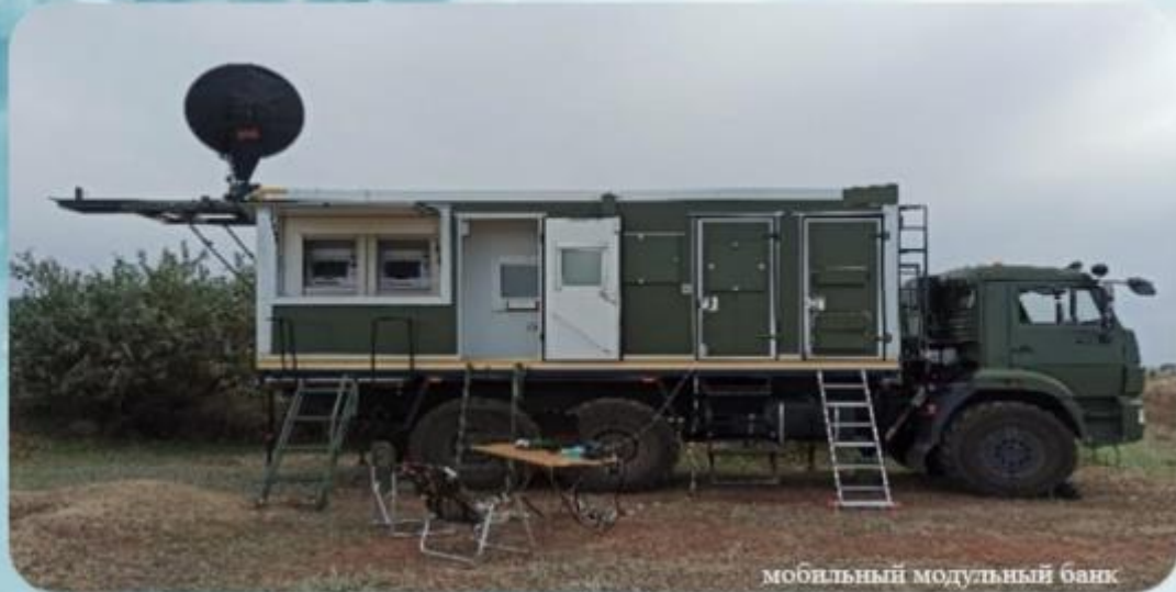
мобильный модульный банк

ЗА 30 СУТОК ПРЕБЫВАНИЯ НА ВОЕННЫХ СБОРАХ: ОФИЦЕР – ОТ 30 ДО 75 ТЫС. РУБЛЕЙ; СОЛДАТЫ, СЕРЖАНТЫ – ДО 25 ТЫС. РУБ. (В ЗАВИСИМОСТИ ОТ РЕГИОНА)